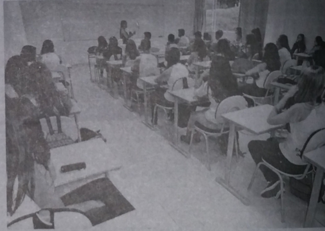
Ensino básico de nível médio atrelado à formação de profissionais técnicos deu um novo sentido à oferta educacional na região