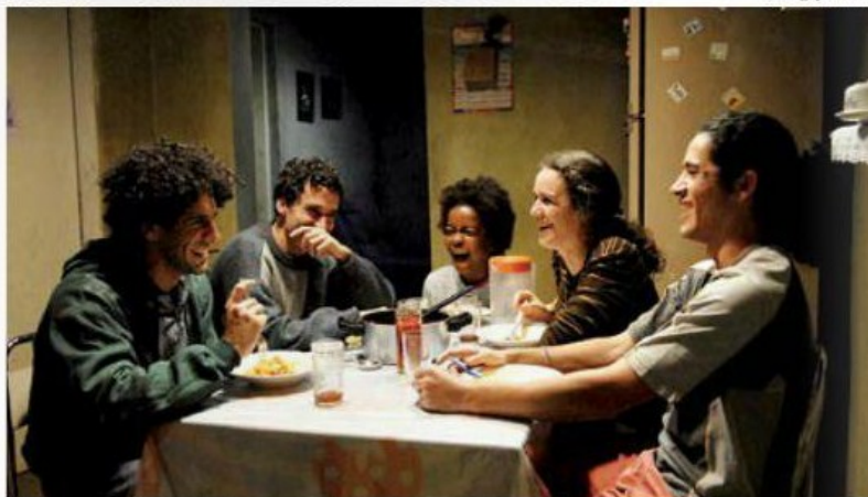
Cena do filme “Linha de Passe”: sessão de estreia do Projeto Cinestória acontece dia 29, no Colégio Padre Nóbrega