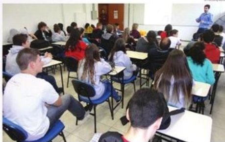
150 vagas disponíveis

b) 232 vagas para candidatos que tenham concluído todo o Ensino Fundamental ou Médio em escolas públicas e ser preto, pardo ou indígena (PPI);