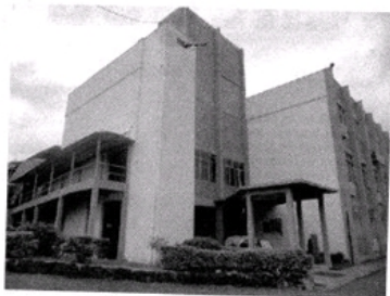
IFC Câmpus Luzerna: parcerias servem também para inserir o aluno no mercado de trabalho

Todos os cursos do IFC, bacharelados ou técnicos, serão beneficiados. Alunos dos técnicos subsequentes de Automação Industrial e de Mecânica poderão fazer seus estágios curriculares nas duas empresas. Quem frequenta os cursos técnicos integrados ao Ensino Médio poderá se valer das visitas técnicas e dos processos de observação, em função das