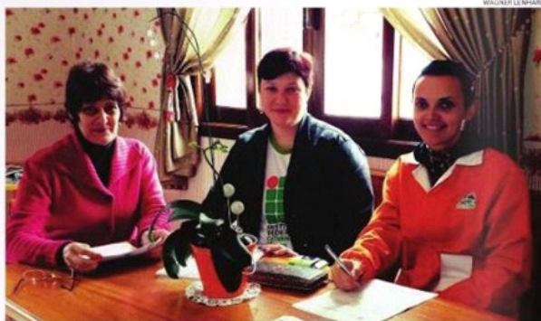
Representantes da Dos Alpes Alimentos e do IFC Câmpus Luzerna firmam parceria

Os processos industriais praticados nas duas empresas favorecem a intenção do IFC no sentido de preparar os estudantes para as exigências do mercado de trabalho regional. A CooCam possui o processo de rações automatizado. "Isso facilitará na aprendizagem de quem cursa o técnico em Automação Industrial e o bacharelado em Engenharia de Controle e Automação, dentro das disciplinas de Controle de Processos Industriais, Controlador Lógico Programável, Sistemas