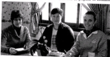
Representantes da Dos Alpes Alimentos e do IFC Câmpus Luzerna firmam parceria