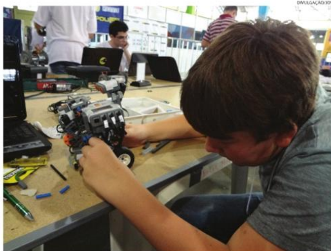
Robô faz parte de projeto para oficinas de robótica com as escolas da região

Robô de sumô foi destaque na Feira do Conhecimento, Cultura e Educação realizada em Chapecó